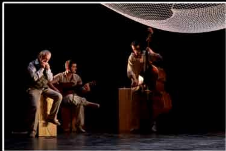
Photos du spectacle

On revient toujours à Buenos Aires pour chercher cette façon mélancolique d'aimer. Seul le sait celui qui à eu à vivre malade de nostalgie, presqu'au point d'en mourir !